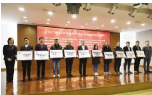
交通投资建设投资有限公司投资建设,该项目位于海宁市海昌路东侧、海州路北侧,项目总建筑面积43268平方米,项