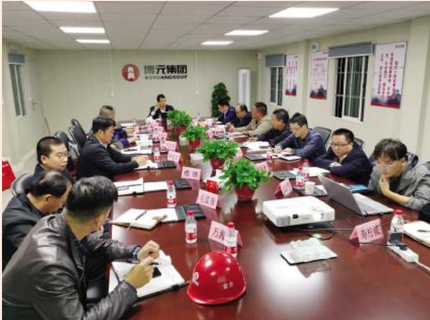
主持召开项目管理工作会议

管理的关键就是带人、带团队，正所谓：火车跑得快，全靠车头带。寿董事长说：“在团队中，我就是‘火车头’，是否懂得带人，直接关系到整个团队的奔跑速度，直接关系到团队的战斗力。个人的力量终究是有限的，管理好团队，让团队拧成一股绳，为共同的目标而努力。只有让整个团队形成合力，才能取得巨大的进步，互相包容，互相合作，才是最好的团队。我的目的是在管理好项目的