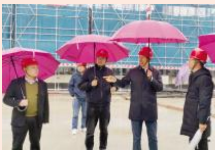
寒冬天冒雨检查工地